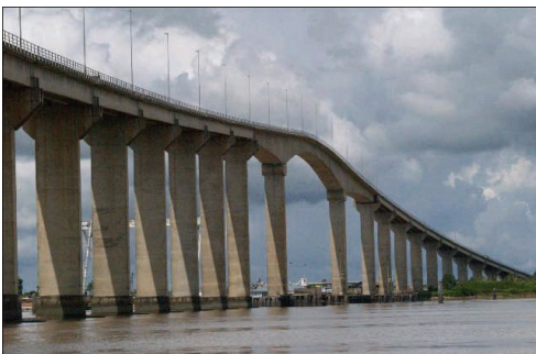
Bekende bruggen van Nederland en Suriname

Het eten dat ze het liefst eet is Nasi Rames. In Suriname hebben ze niet zo heel veel last van de economische crisis, omdat ze altijd al zuinig hebben leren leven, en ze doen er weinig in de import en export. Ze vindt Nederland koud, mooi weer maar koud en je ziet de zon wel maar je voelt hem niet. Er is weinig/geen discriminatie in Suriname.